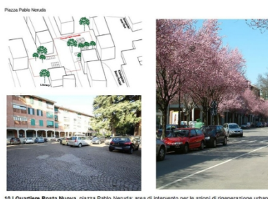
10 | Quartiere Rosta Nuova, piazza Pablo Neruda: area di intervento per le azioni di rigenerazione urbana

FINANZIAMENTO RICHIESTO (al netto dell'eventuale co-finanziamento )