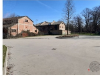
5 | Area per il Workshop Camposaz: realtà presenti sul territorio e individuazione area oggetto di microrigenerazione