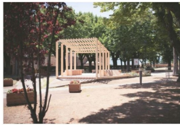
6 | Esempio di allestimento di Camposaz a san Ginesio, Macerata, Italy nf. https://www.camposaz.com/portfolio/1010-terre-terremotate/