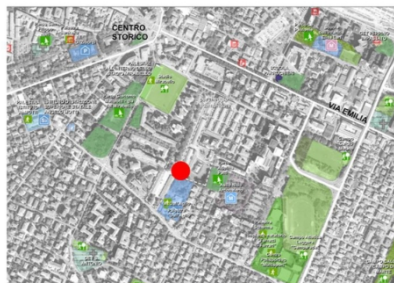
4 | Quartiere nel quale si colloca il Workshop Composaz