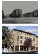
8 | Quartiere Rosta Nuova inquadramento di contesto, fotografie di ieri e oggi