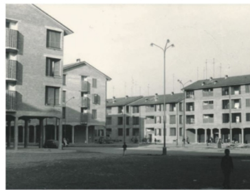
7 | Quartiere Rosta Nuova nel quale si svolgeranno azioni di rigenerazione urbana